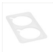
FANTASY elemento PMMA due fori GN 1/3 INSERT07