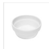
FANTASY ciotola porcellana Ø cm 14,5 PORCELAIN 145