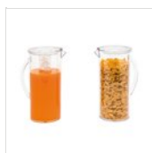
FANTASY caraffa multiuso (2,8l) - master pack 12 pezzi 50300720