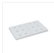
FANTASY placca eutettica GN 1/2 ICEPACK GN12

Per esigenze tecniche i dati citati ed i particolari fotografati non sono impegnativi e possono essere modificati senza preavviso. Le nostre condizioni commerciali sono disponibili su richiesta. Essendo il legno un prodotto naturale, i colori qui riprodotti sono puramente indicativi. Eventuali differenze cromatiche rispetto ai campioni o a precedenti spedizioni non costituiscono quindi motivo di reclamo. Tutti i componenti e tutti i materiali a contatto con gli alimenti sono stati testati e approvati come idonei ad uso alimentare, secondo le norme stabilite per legge. Tutti i diritti riservati - ©Ze Pé.