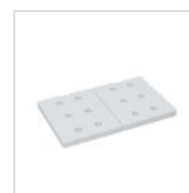
FANTASY placca eutettica GN 1/2 ICEPACK GN12

Per esigenze tecniche i dati citati ed i particolari fotografati non sono impegnativi e possono essere modificati senza preavviso. Le nostre condizioni commerciali sono disponibili su richiesta. Essendo il legno un prodotto naturale, i colori qui riprodotti sono puramente indicativi. Eventuali differenze cromatiche rispetto ai campioni o a precedenti spedizioni non costituiscono quindi motivo di reclamo. Tutti i componenti e tutti i materiali a contatto con gli alimenti sono stati testati e approvati come idonei ad uso alimentare, secondo le norme stabilite per legge. Tutti i diritti riservati - ©Ze Pé.