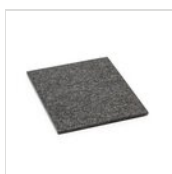
FANTASY elemento granito scuro GN 1/2 GRANITO SCURO