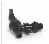
Rubinetto nero universale RUB-P