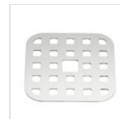
Griglia quadrata 11,2 x 11,2 cm in inox 01 GRI

Per esigenze tecniche i dati citati ed i particolari fotografati non sono impegnativi e possono essere modificati senza preavviso. Le nostre condizioni commerciali sono disponibili su richiesta. Essendo il legno un prodotto naturale, i colori qui riprodotti sono puramente indicativi. Eventuali differenze cromatiche rispetto ai campioni o a precedenti spedizioni non costituiscono quindi motivo di reclamo. Tutti i componenti e tutti i materiali a contatto con gli alimenti sono stati testati e approvati come idonei ad uso alimentare, secondo le norme stabilite per legge. Tutti i diritti riservati - ©Ze Pé.