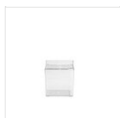
CONTENITORE ESPOSITORE IN TRITAN (2,5 L) - MULTIUSO 50300730