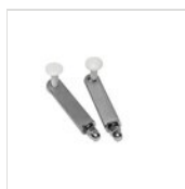
FANTASY sistema fissaggio per cloche GN GN FIXING SYSTEM

Per esigenze tecniche i dati citati ed i particolari fotografati non sono impegnativi e possono essere modificati senza preavviso. Le nostre condizioni commerciali sono disponibili su richiesta. Essendo il legno un prodotto naturale, i colori qui riprodotti sono puramente indicativi. Eventuali differenze cromatiche rispetto ai campioni o a precedenti spedizioni non costituiscono quindi motivo di reclamo. Tutti i componenti e tutti i materiali a contatto con gli alimenti sono stati testati e approvati come idonei ad uso alimentare, secondo le norme stabilite per legge. Tutti i diritti riservati - ©Ze Pé.