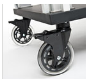
Ruota Ø 125 mm con FRENO (TACTUS nero) set 4 ruote RUOTA TACTUS BLACK