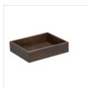
ESPOSITORE IN LEGNO GN 1/2 82100015

Per esigenze tecniche i dati citati ed i particolari fotografati non sono impegnativi e possono essere modificati senza preavviso. Le nostre condizioni commerciali sono disponibili su richiesta. Essendo il legno un prodotto naturale, i colori qui riprodotti sono puramente indicativi. Eventuali differenze cromatiche rispetto ai campioni o a precedenti spedizioni non costituiscono quindi motivo di reclamo. Tutti i componenti e tutti i materiali a contatto con gli alimenti sono stati testati e approvati come idonei ad uso alimentare, secondo le norme stabilite per legge. Tutti i diritti riservati