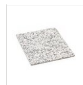
FANTASY elemento granito chiaro GN 1/2 GRANITO CHIARO