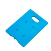
Mattonella eutettica 20 x 29 cm 50303453BR