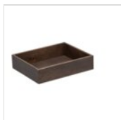
ESPOSITORE IN LEGNO GN 1/2 82100015