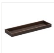
Espositore in legno GN 2/4 82100017