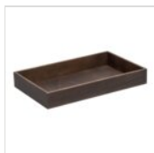
ESPOSITORE IN LEGNO GN 1/1 82100013