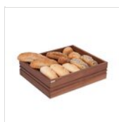
NATURE box pane GN 1/2 15A11150