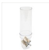
Contenitore cereali rotondo (3l) MULINO PACK 3L