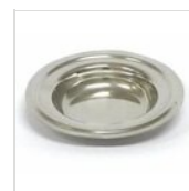
Raccogli gocce Ø 14 cm in inox PIATTINO 14

Per esigenze tecniche i dati citati ed i particolari fotografati non sono impegnativi e possono essere modificati senza preavviso. Le nostre condizioni commerciali sono disponibili su richiesta. Essendo il legno un prodotto naturale, i colori qui riprodotti sono puramente indicativi. Eventuali differenze cromatiche rispetto ai campioni o a precedenti spedizioni non costituiscono quindi motivo di reclamo. Tutti i componenti e tutti i materiali a contatto con gli alimenti sono stati testati e approvati come idonei ad uso alimentare, secondo le norme stabilite per legge. Tutti i diritti riservati - ©Ze Pé.