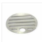
Griglia Ø 11,9 cm in inox GRI1