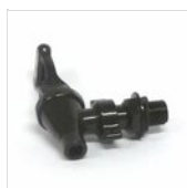
Rubinetto nero universale RUB-P