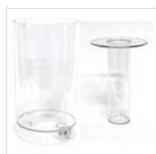
Contenitore e tubo del ghiaccio rotondo (4l) CONT-ICE 2 (4L)