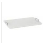
Tagliere GN in polietilene (PE) con maniglie TAGLIERE GN