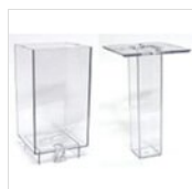
Récipient et tube à glace pour distributeur à jus rectangulaire (6l) GRI-ICE01