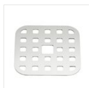
Plateau d'égouttage carrée en acier inoxydable 11,2 x 11,2 cm en 01 GRI

Pour des raisons de fabrication, les spécifications mentionnées ne sont pas contraignantes et peuvent être modifiées sans préavis. Les conditions de vente sont disponibles sur demande. Le bois étant un produit naturel, les couleurs indiquées ne sont qu'indicatives. Les éventuelles différences de couleur et de grain par rapport aux échantillons et aux livraisons précédentes ne constituent pas un motif de réclamation. Toutes les pièces et les matériaux en contact direct avec les aliments ont été testés et approuvés pour le contact alimentaire selon les règles établies par la loi. Tous droits réservés - ©Ze Pé.