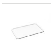
FANTASY Plateaux en porcelaine GN 1/1 PORCELLANA GN