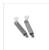
FANTASY Système de montage pour cloche GN 1/1 GN FIXING SYSTEM