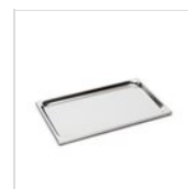
FANTASY Plateaux en acier inoxydable GN 1/1 VASSOIO GN 20