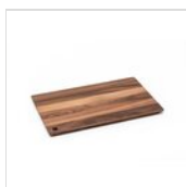
FANTASY Élément en bois GN 1/1 INSERT10

Pour des raisons de fabrication, les spécifications mentionnées ne sont pas contraignantes et peuvent être modifiées sans préavis. Les conditions de vente sont disponibles sur demande. Le bois étant un produit naturel, les couleurs indiquées ne sont qu'indicatives. Les éventuelles différences de couleur et de grain par rapport aux échantillons et aux livraisons précédentes ne constituent pas un motif de réclamation. Toutes les pièces et les matériaux en contact direct avec les aliments ont été testés et approuvés pour le contact alimentaire selon les règles établies par la loi. Tous droits réservés - ©Ze Pé.