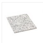
FANTASY Élément de granit - couleur claire GN 1/2 GRANITO CHIARO