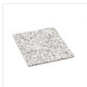
FANTASY Élément de granit - couleur claire GN 1/2 GRANITO CHIARO