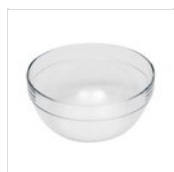
FANTASY Saladier Ø 23 cm INSALATIERA 23