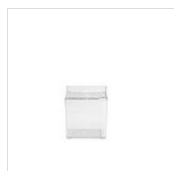
TRITAN PRÉSENTATION (2,5 L) - POLYVALENT 50300730