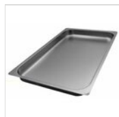
Grand insert en acier inoxydable pour glacière - rectangulaire pour chariots BACINELLA 60

Pour des raisons de fabrication, les spécifications mentionnées ne sont pas contraignantes et peuvent être modifiées sans préavis. Les conditions de vente sont disponibles sur demande. Le bois étant un produit naturel, les couleurs indiquées ne sont qu'indicatives. Les éventuelles différences de couleur et de grain par rapport aux échantillons et aux livraisons précédentes ne constituent pas un motif de réclamation. Toutes les pièces et les matériaux en contact direct avec les aliments ont été testés et approuvés pour le contact alimentaire selon les règles établies par la loi. Tous droits réservés - ©Ze Pé.