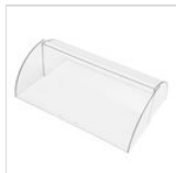
Cloche - rectangulaire pour chariots