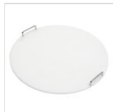
Planche à découper ronde en PE pour chariots