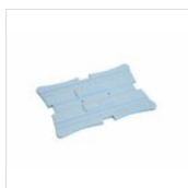
Pack de glace Zepe standard rectangulaire (boîte de 12 pièces) 50303453