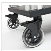
Jeu de 4 roues pour le TACTUS noir (toutes avec freins) RUOTA TACTUS BLACK