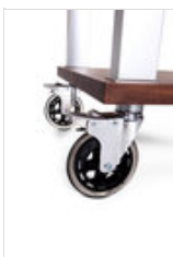
Set de 4 roues diamètre 125 mm (toutes avec freins)