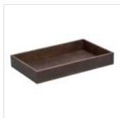
PRÉSENTOIR EN BOIS GN