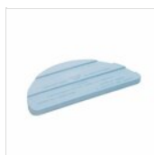
Plaque eutectique Zepe standard demi-rond 50303113

Pour des raisons de fabrication, les spécifications mentionnées ne sont pas contraignantes et peuvent être modifiées sans préavis. Les conditions de vente sont disponibles sur demande. Le bois étant un produit naturel, les couleurs indiquées ne sont qu'indicatives. Les éventuelles différences de couleur et de grain par rapport aux échantillons et aux livraisons précédentes ne constituent pas un motif de réclamation. Toutes les pièces et les matériaux en contact direct avec les aliments ont été testés et approuvés pour le contact alimentaire selon les règles établies par la loi. Tous droits réservés - ©Ze Pé.