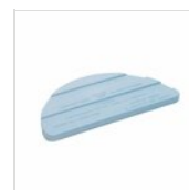
Plaque eutectique Zepe standard demi-rond 50303113

Pour des raisons de fabrication, les spécifications mentionnées ne sont pas contraignantes et peuvent être modifiées sans préavis. Les conditions de vente sont disponibles sur demande. Le bois étant un produit naturel, les couleurs indiquées ne sont qu'indicatives. Les éventuelles différences de couleur et de grain par rapport aux échantillons et aux livraisons précédentes ne constituent pas un motif de réclamation. Toutes les pièces et les matériaux en contact direct avec les aliments ont été testés et approuvés pour le contact alimentaire selon les règles établies par la loi. Tous droits réservés - ©Ze Pé.