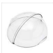
Cloche rond Ø 45 cm sans système de fixation 50305300