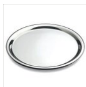
Plateau rond en acier inoxydable Ø 42,5 cm VASSOIO 425x20