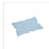
Pack de glace Zepe standard rectangulaire (boîte de 12 pièces) 50303453

Pour des raisons de fabrication, les spécifications mentionnées ne sont pas contraignantes et peuvent être modifiées sans préavis. Les conditions de vente sont disponibles sur demande. Le bois étant un produit naturel, les couleurs indiquées ne sont qu'indicatives. Les éventuelles différences de couleur et de grain par rapport aux échantillons et aux livraisons précédentes ne constituent pas un motif de réclamation. Toutes les pièces et les matériaux en contact direct avec les aliments ont été testés et approuvés pour le contact alimentaire selon les règles établies par la loi. Tous droits réservés - ©Ze Pé.