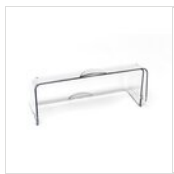
FANTASY Cloche GN 1/1 sans système de montage CLOCHE GN