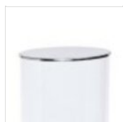
Couvercle rond en acier inoxydable pour distributeur de céréales (3L) sans poignée COPERCHIO 332