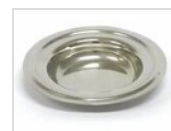
Plateau d'égouttage en acier inoxydable Ø 14 cm PIATTINO 14

Pour des raisons de fabrication, les spécifications mentionnées ne sont pas contraignantes et peuvent être modifiées sans préavis. Les conditions de vente sont disponibles sur demande. Le bois étant un produit naturel, les couleurs indiquées ne sont qu'indicatives. Les éventuelles différences de couleur et de grain par rapport aux échantillons et aux livraisons précédentes ne constituent pas un motif de réclamation. Toutes les pièces et les matériaux en contact direct avec les aliments ont été testés et approuvés pour le contact alimentaire selon les règles établies par la loi. Tous droits réservés - ©Ze Pé.