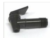
Petit robinet noir RUB-ECO