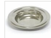
Plateau d'égouttage en acier inoxydable Ø 14 cm PIATTINO 14

Pour des raisons de fabrication, les spécifications mentionnées ne sont pas contraignantes et peuvent être modifiées sans préavis. Les conditions de vente sont disponibles sur demande. Le bois étant un produit naturel, les couleurs indiquées ne sont qu'indicatives. Les éventuelles différences de couleur et de grain par rapport aux échantillons et aux livraisons précédentes ne constituent pas un motif de réclamation. Toutes les pièces et les matériaux en contact direct avec les aliments ont été testés et approuvés pour le contact alimentaire selon les règles établies par la loi. Tous droits réservés - ©Ze Pé.