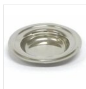
Plateau d'égouttage en acier inoxydable Ø 14 cm PIATTINO 14

Pour des raisons de fabrication, les spécifications mentionnées ne sont pas contraignantes et peuvent être modifiées sans préavis. Les conditions de vente sont disponibles sur demande. Le bois étant un produit naturel, les couleurs indiquées ne sont qu'indicatives. Les éventuelles différences de couleur et de grain par rapport aux échantillons et aux livraisons précédentes ne constituent pas un motif de réclamation. Toutes les pièces et les matériaux en contact direct avec les aliments ont été testés et approuvés pour le contact alimentaire selon les règles établies par la loi. Tous droits réservés - ©Ze Pé.