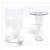
Récipient et tube à glace pour récipient à jus rond (7l) CONT-ICE 1 (7L)