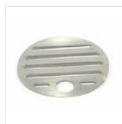
Grille d'égouttage Ø 11,9 cm en acier inoxydable GRI1