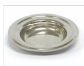
Plaque d'égouttage en acier inoxydable Ø 12 cm RACC2

Pour des raisons de fabrication, les spécifications mentionnées ne sont pas contraignantes et peuvent être modifiées sans préavis. Les conditions de vente sont disponibles sur demande. Le bois étant un produit naturel, les couleurs indiquées ne sont qu'indicatives. Les éventuelles différences de couleur et de grain par rapport aux échantillons et aux livraisons précédentes ne constituent pas un motif de réclamation. Toutes les pièces et les matériaux en contact direct avec les aliments ont été testés et approuvés pour le contact alimentaire selon les règles établies par la loi. Tous droits réservés - ©Ze Pé.