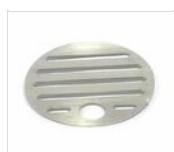
Grille d'égouttage en acier inoxydable Ø 9,9 cm GRI2