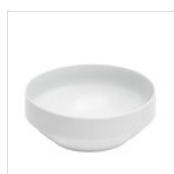
Bol en porcelaine blanche Ø 23 cm CIOTOLA 23cm