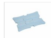
Pack de glace Zepe standard rectangulaire (boîte de 12 pièces) 50303453

Pour des raisons de fabrication, les spécifications mentionnées ne sont pas contraignantes et peuvent être modifiées sans préavis. Les conditions de vente sont disponibles sur demande. Le bois étant un produit naturel, les couleurs indiquées ne sont qu'indicatives. Les éventuelles différences de couleur et de grain par rapport aux échantillons et aux livraisons précédentes ne constituent pas un motif de réclamation. Toutes les pièces et les matériaux en contact direct avec les aliments ont été testés et approuvés pour le contact alimentaire selon les règles établies par la loi. Tous droits réservés - ©Ze Pé.