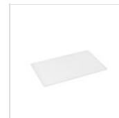
FANTASY Polyethyleneinsatz GN 1/1 INSERT08