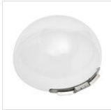
Runde Haube für runde Servierwagen