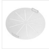
Rundes Tablett in Edelstahl für runde Servierwagen