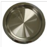
Runde Wanne aus Edelstahl für gekühlte runde Servierwagen