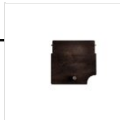
HOLZDECKEL FÜR ART. 50300730 50300731

Aus produktionstechnischen Gründen sind die genannten Informationen unverbindlich und können ohne vorherige Ankündigung geändert werden. Verkaufsbedingungen sind auf Anfrage erhältlich. Da es sich bei dem Material Holz um ein Naturprodukt handelt, sind die abgebildeten Farben nur Richtwerte. Eventuelle Farb- und Maserungsunterschiede gegenüber Mustern und früheren Lieferungen sind kein Reklamationsgrund. Alle Teile und Materialien mit direktem Kontakt mit Lebensmitteln sind nach den gesetzlichen Vorschriften für den Lebensmittelkontakt geprüft und zugelassen. Alle Rechte vorbehalten - ©Ze Pé.