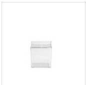
TRITAN- PRÄSENTATIONSBEHÄLTNIS (2,5 L) - MULTIFUNKTIONAL 50300730