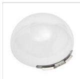
Runde Haube für runde Servierwagen