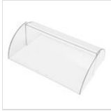
Rechteckige Haube für Servierwagen