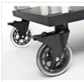
Set mit 4 Rädern - Ø 125 mm alle mit Bremsen (TACTUS schwarz) RUOTA TACTUS BLACK