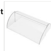
Rechteckige Haube für Servierwagen 90225030