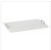
Rechteckiges Schneidebrett in PE mit Griffen für Servierwagen TAGLIERE 64x44