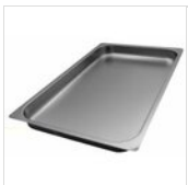
Rechteckige Wanne aus Edelstahl für gekühlte Servierwagen BACINELLA 60

Aus produktionstechnischen Gründen sind die genannten Informationen unverbindlich und können ohne vorherige Ankündigung geändert werden. Verkaufsbedingungen sind auf Anfrage erhältlich. Da es sich bei dem Material Holz um ein Naturprodukt handelt, sind die abgebildeten Farben nur Richtwerte. Eventuelle Farb- und Maserungsunterschiede gegenüber Mustern und früheren Lieferungen sind kein Reklamationsgrund. Alle Teile und Materialien mit direktem Kontakt mit Lebensmitteln sind nach den gesetzlichen Vorschriften für den Lebensmittelkontakt geprüft und zugelassen. Alle Rechte vorbehalten - ©Ze Pé.