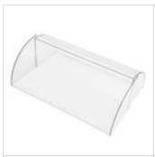
Rechteckige Haube für Servierwagen 90225030