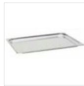
Rechteckiges Tablett aus Edelstahl für Servierwagen COPERCHIO 60