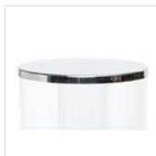
Runder Deckel in Inox für Saftspender (7l) ohne Haltekopf FONDELLO 203 LUCIDATO