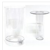
Saft- und Eisbehälter rund (7l) CONT-ICE 1 (7L)