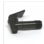
Zapfhahn schwarz klein RUB-ECO