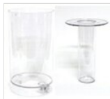
Saft- und Eisbehälter rund (7l)